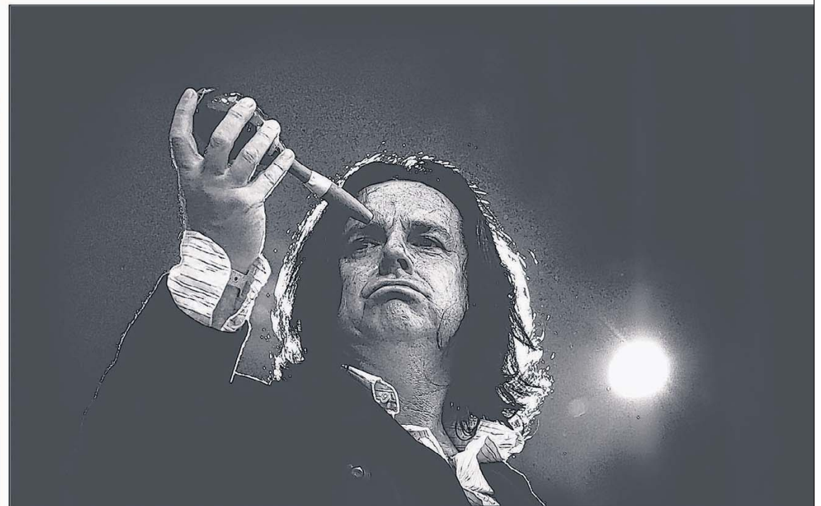
Vier portretten uit het boek 'Why Music?', deel twee'. Met de klok mee: